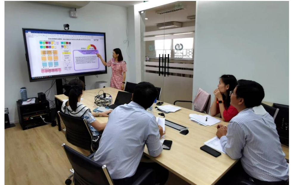
ภาพการประชุมร่วมกันของงานนโยบายและประเมินผล