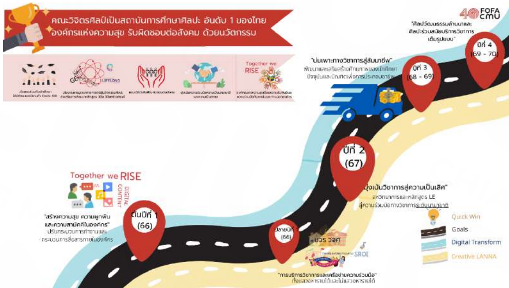
ภาพที่ 1 แนวทางการบริหารแผนงานตาม แผนยุทธศาสตร์คณะวิจิตรศิลป์ ระยะ 4 ปี (พ.ศ. 2566 – 2570)

แนวทางการบริหารคณะวิจิตรศิลป์ ได้กำหนดแผนงานเพื่อการบริหารงานภายใต้แผนยุทธศาสตร์คณะวิจิตรศิลป์ มหาวิทยาลัยเชียงใหม่ ระยะ 4 ปี (พ.ศ. 2566 - 2570) รายละเอียดดังนี้