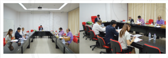
คณะกรรมการประเมินผลการบริหารงานของผู้ดำรงตำแหน่ง หัวหน้าสำนักงาน ได้ประชุมเพื่อพิจารณาผลการปฏิบัติงานของผู้อำนวยการสำนักหอสมุด (ครั้งที่ 2 รอบ 3 ปี) เมื่อวันที่ 27 สิงหาคม 2559