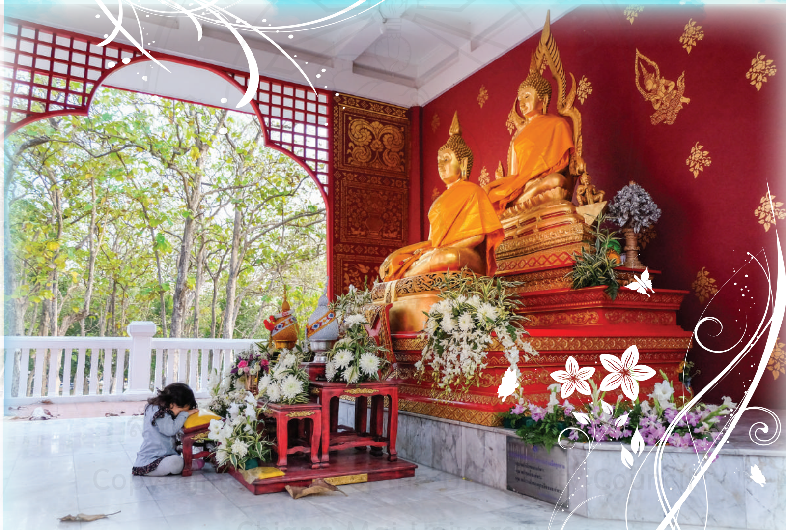
“กราบพระศาสดาธรรม”