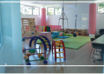
คลินิกกิจกรรมบำบัด