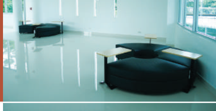
Co-Working Space (ชั้น 3)