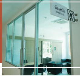
ห้องตรวจจิตเวช