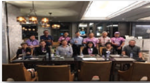
สนับสนุนการตั้งสมาคมศิษย์เก่า คณะเภสัชศาสตร์

ด้านที่ 3 ส่งเสริมสนับสนุนการสร้างเครือข่ายของชมรมสมาคม นักศึกษาเก่ามหาวิทยาลัยเชียงใหม่คนละต่าง ๆ ให้เกิดความเข้มแข็ง