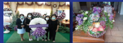
วางหรือตกแต่งศพ/เยี่ยมไข้

ด้านที่ 6 ส่งเสริมสนับสนุน สงเคราะห์ช่วยเหลือนักศึกษาปัจจุบัน นักศึกษาเก่าและอาจารย์มหาวิทยาลัยเชียงใหม่