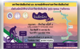
กิจกรรมปั่นเพื่อห้องกรุงเทพฯ - ชม.

ด้านที่ 5 สนับสนุนทุนการศึกษาสำหรับนักศึกษา มหาวิทยาลัยเชียงใหม่ ในทุกคณะ