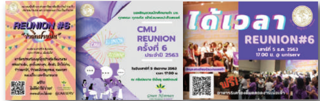
กิจกรรม CMU REUNION

ด้านที่ 4 ส่งเสริมสัมพันธภาพและสนับสนุนการทำงานระหว่างสมาคม นักศึกษาเก่ามหาวิทยาลัยเชียงใหม่ กับชมรม สมาคม ของ คณะ ของจังหวัด และนักศึกษาเก่าทั้งในประเทศและต่างประเทศ รวมทั้งเชื่อมโยงการทำงานกับศูนย์สื่อสารองค์กรและนักศึกษาเก่าสัมพันธ์ มหาวิทยาลัยเชียงใหม่