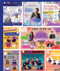
CMU BUSINESS CLUB

ด้านที่ 7 ส่งเสริมสนับสนุนกิจกรรมที่เป็นประโยชน์ และสร้างสรรค์ ของนักศึกษาเก่า และ นักศึกษาปัจจุบันทุกคน