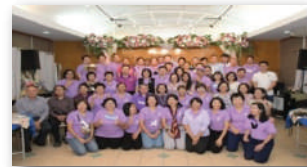
กิจกรรมพบปะ สานสัมพันธ์เครือข่าย สมาคมนักศึกษาเก่า

ด้านที่ 4 ส่งเสริมสัมพันธภาพและสนับสนุนการทำงานระหว่างสมาคม นักศึกษาเก่ามหาวิทยาลัยเชียงใหม่ กับชมรม สมาคม ของ คณะ ของจังหวัด และนักศึกษาเก่าทั้งในประเทศและต่างประเทศ รวมทั้งเชื่อมโยงการทำงานกับศูนย์สื่อสารองค์กรและนักศึกษาเก่าสัมพันธ์ มหาวิทยาลัยเชียงใหม่