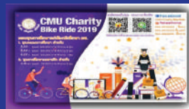
พิจารณาจัดสรรทุนต่อเนื่อง CMU CHARITY BIKE RIDE 2019 จำนวน 1,500,000 บาท

ด้านที่ 5 สนับสนุนทุนการศึกษาสำหรับนักศึกษา มหาวิทยาลัยเชียงใหม่ ในทุกคณะ