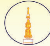
พระมหัพัตร์

ตราสัญลักษณ์พระราชพิธีบรมราชาภิเษก พุทธศักราช ๒๕๖๒