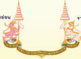
ราชสีห์ก้ามวงขาว