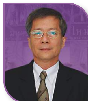
ศ.เกียรติคุณ ดร.ปิยะวัติ บุญ-หลง