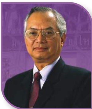
ศ.ดร.พงษ์ศักดิ์ อังกสิทธิ์ อธิการบดีมหาวิทยาลัยเชียงใหม่