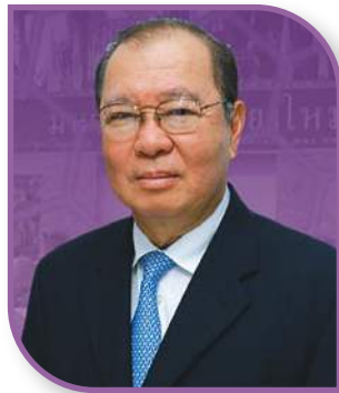
ศ.นพ.สิน อุนราษกุล