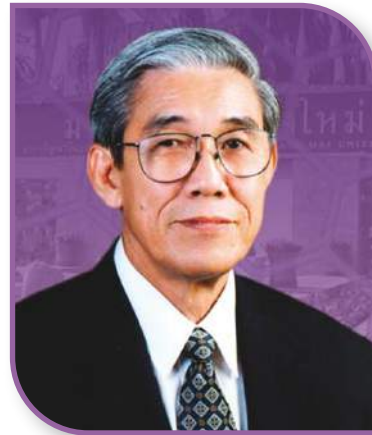
ศ.เกียรติคุณ นพ.อาวุธ ศรีศุกรี อุปนายกสภามหาวิทยาลัยเชียงใหม่