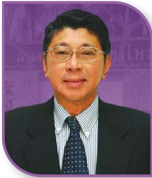
ศ.กิตติคุณ ดร.วิชณุ เครื่องงาม